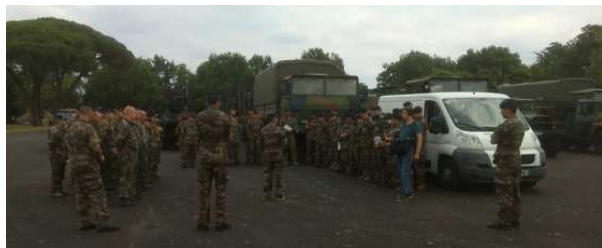
Préparatif en présence de médias de RFI