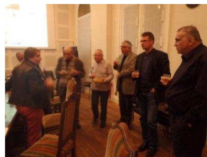
Verre de l'amitié, à l'issue de l'Assemblée Générale, à la Préfecture d'Angers

Les postes de 2 e vice président, représentant les sous-officiers, et de 3 e vice-président représentant les militaires du rang, n'ont pas été pourvus sur décision à l'unanimité à l'AG, afin de faciliter leur entrée et représentativité dans l'association.